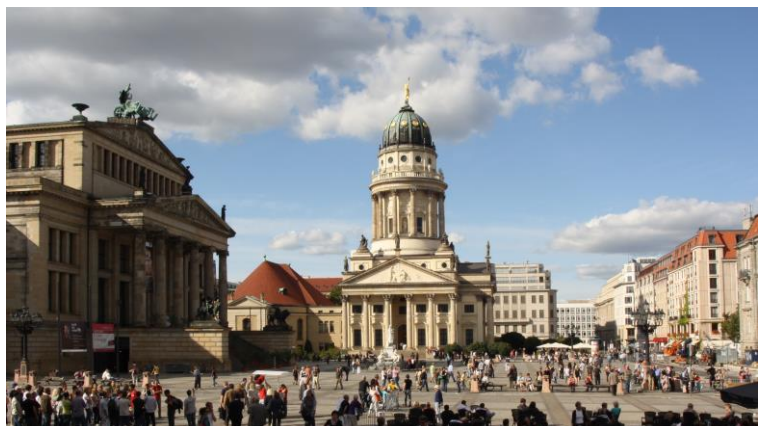
Gendarmenmarkt, Berlins smukkeste plads, som vi ser på sightseeing.