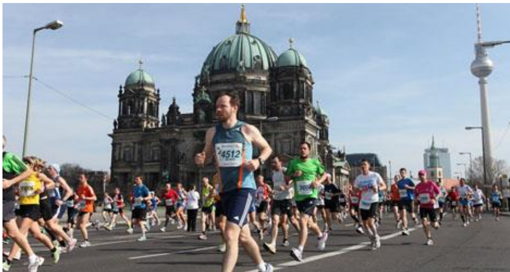
Vi løber forbi Berliner Dom på Museumsinsel.