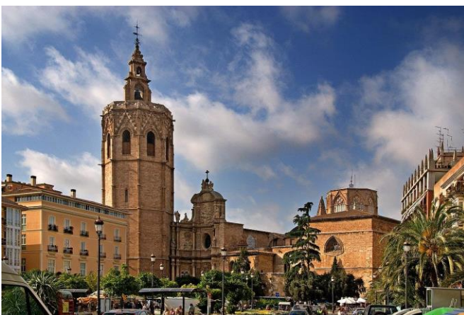
Cathedral de Santa Maria

Der er ikke inkluderet nogen forsikringer, hverken sygdomsafbestillingsforsikring, rejsegodsforsikring eller andet. Vi anbefaler en sygdomsafbestillingsforsikring, som især er vigtig i tilfælde af, at du bliver skadet. Undersøg selv hos dit eget forsikringselskab, hvordan du er forsikret.