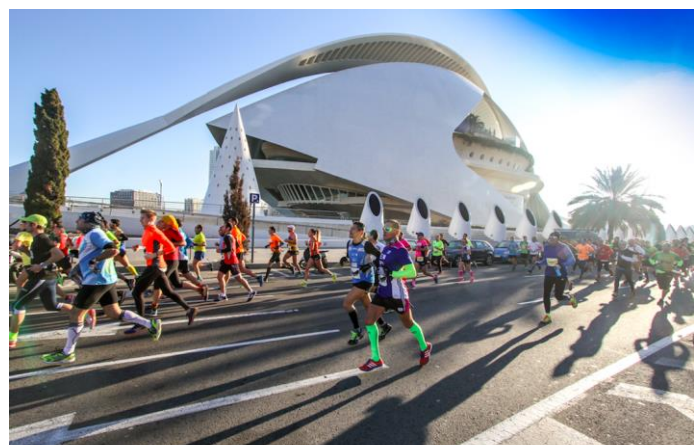
På Valencia Half Marathon løber man forbi City of Arts and Sciences.